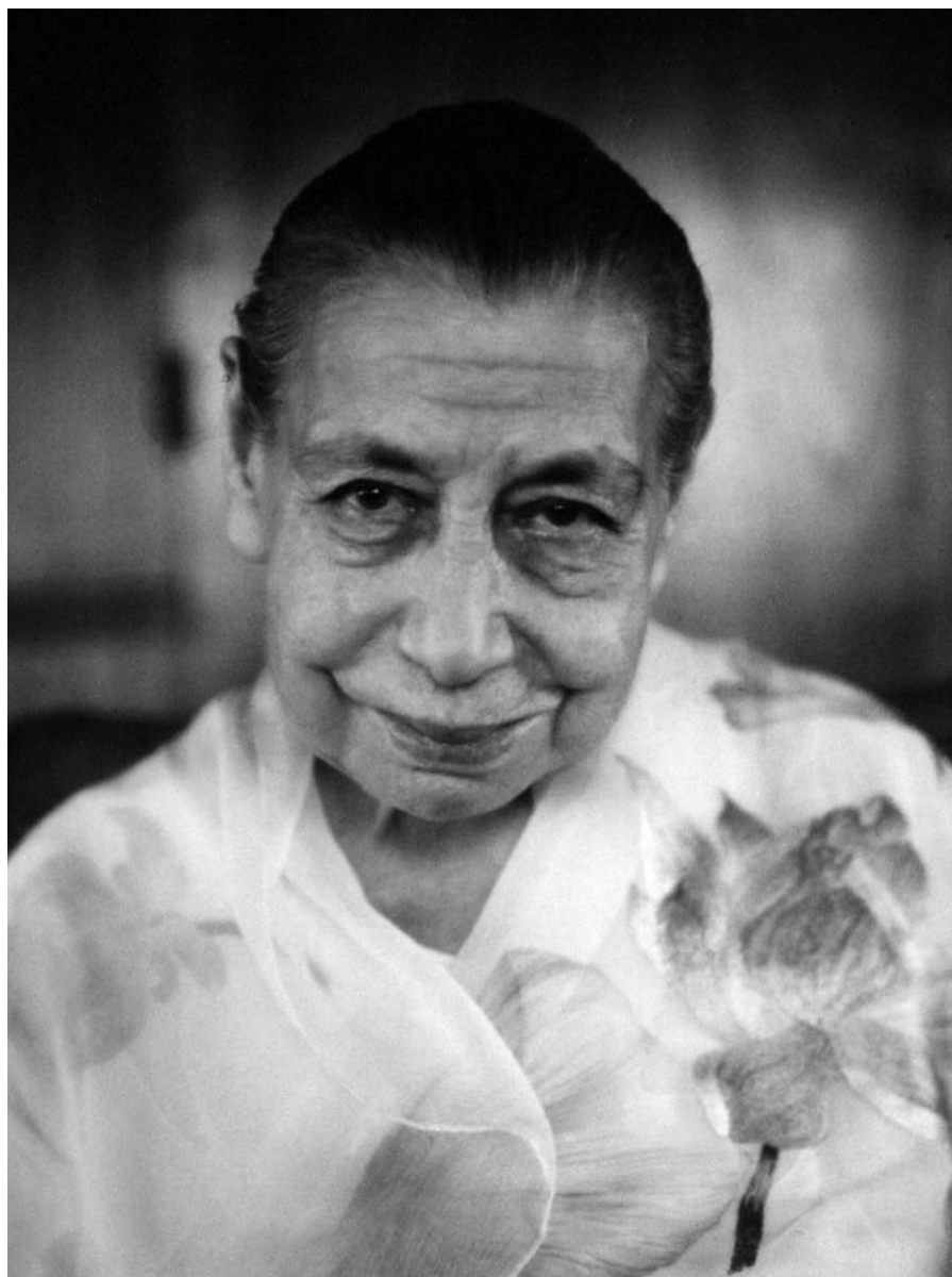
МИРРА АЛЬФАССА (МАТЬ)