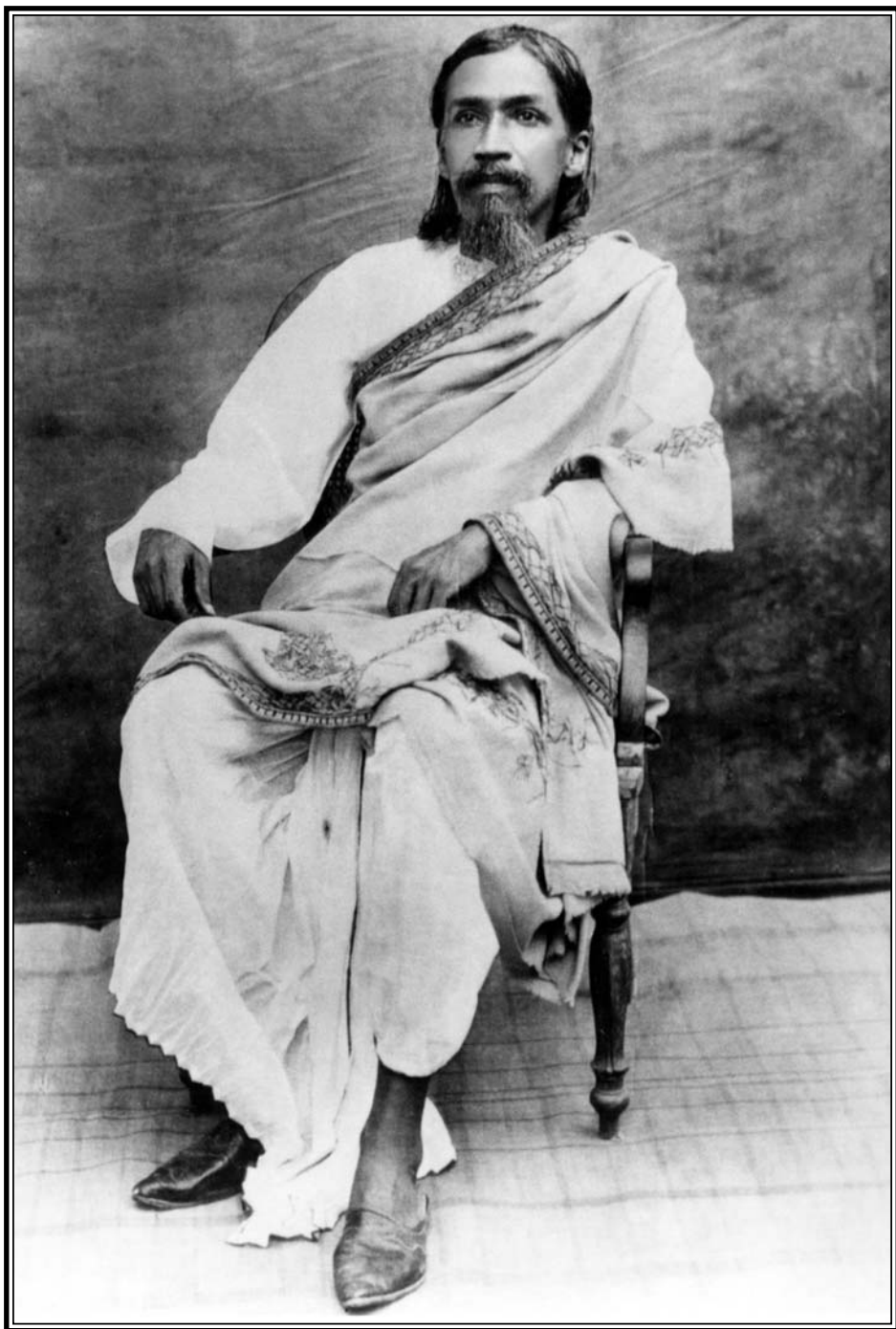
Шри Ауробиндо, Пондичери, 1915—1918 г.